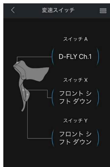
○インナー固定の変速スイッチ設定